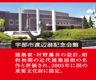
宇部市渡辺翁記念会館

ときわ公園の彫刻野外展示場では、1961年以来、国内有数の歴史と権威を誇る「UBEビエンナーレ」として開催。